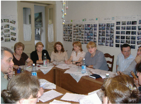
ადგილობრივი ორგანიზაციის დაფუძნების მომზადება