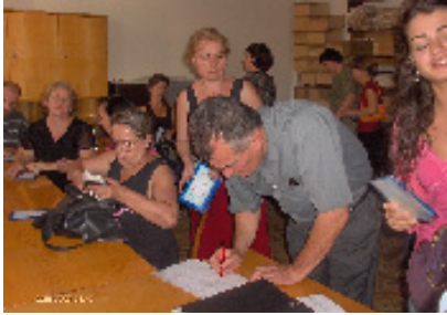
ქსელის წესდების განხილვა

პროექტის განხორციელების მიმდინარე ეტაპზე საპროექტო ქაღალეებში ორგანიზება გაუკეთდა საინფორმაციო შეხვედრებს იმ ადამიანების თუ ორგანიზაციების წარმომადგენლების მონაწილეობით, რომლებმაც სურვილი გამოხატეს ქსელში გაწევრიანების შესახებ. აღნიშნულ შეხვედრებზე მონაწილეებს საკონსულტაციო ცენტრების წარმომადგენლებმა მიაწოდეს ინფორმაცია პროექტის ფარგლებში განხორციელებული საქმიანობების შესახებ, განიხილეს ხელისუფლების მიერ შემუშავებული დევნილთა სტრატეგიის სამოქმედო გეგმა და დაგეგმილი უახლოესი ტრენინგების პროგრამა, დევნილთა განათლების სიტუაციური ანალიზის ჯგუფის შექმნის საკითხები, ასევე ქსელის ოფიციალური დაფუძნების ინიციატივა და, კონკრეტულად, წესდების სამუშაო ვარიანტი.