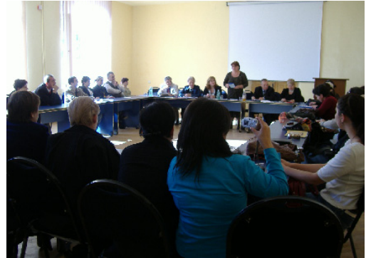
საინფორმაციო შეხვედრა ქუთაისში