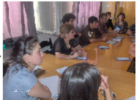
საინფორმაციო შეხვედრა თბილისში

ვიდრე პროექტის ფარგლებში მოხდება სიტუაციური ანალიზის ჯგუფის ფორმირება და დაიწყება მასშტაბური კვლევის განხორციელება, ტრენერ-კონსულტანტების თბილისის ჯგუფის ინიციატივით განხორციელდა მცირემასშტაბიანი კვლევა, რომლის მთავარი ამოცანა გახლდათ გაერკვია, არსებობდა თუ არა კავშირის დევნილთა კოლექტიური ცხოვრების ცენტრებში და დევნილთა სკოლებში სწავლებასა და აფხაზეთში დაბრუნების მოტივაციას შორის, ანუ საზოგადოებაში სრულფასოვანი ინტეგრაცია აისახება თუ არა უარყოფითად მუდმივის ცხოვრების ადგილებში დაბრუნების სურვილზე.