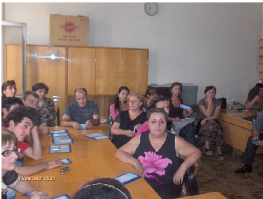
სამუშაო შეხვედრა სიტუაციური ანალიზის ჯგუფის ჩამოსაყალიბებლად

განათლების გზით დევნილთა ინტეგრაციის საკითხებზე საზოგადოების მაქსიმალური ჩართულობის უზრუნველყოფის მიზნით პროექტის ფარგლებში დაგეგმილი იყო ინტერნეტ ფორუმის შექმნა. სწორედ ამ მიზნით განათლების პოლიტიკის, დაგეგმვისა და მართვის საერთაშორისო ინსტიტუტის (EPPM) ვებ გვერდზე დაიწყო ფუნქციონირება აღნიშნულმა ინტერნეტ ფორუმმა ( www.eepm.org.ge ). ფორუმი საშუალებას მოგვცემს, რომ დევნილთა სტრატეგიისა თუ სამოქმედო გეგმის შემუშავების, განხორციელების თუ შეფასების საკითხებში აქტიურად ჩაერთოს დევნილები და მთლიანად სამოქალაქო საზოგადოება, როგორც საპროექტო ქალაქებიდან/რეგიონებიდან, ასევე საქართველოსა და საზღვარგარეთის ნებისმიერი ადგილიდან. მოგიწოდებთ, ისარგებლოთ ამ სერვისით.